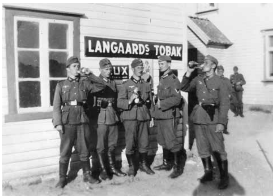
Tyske soldater på Ognå.