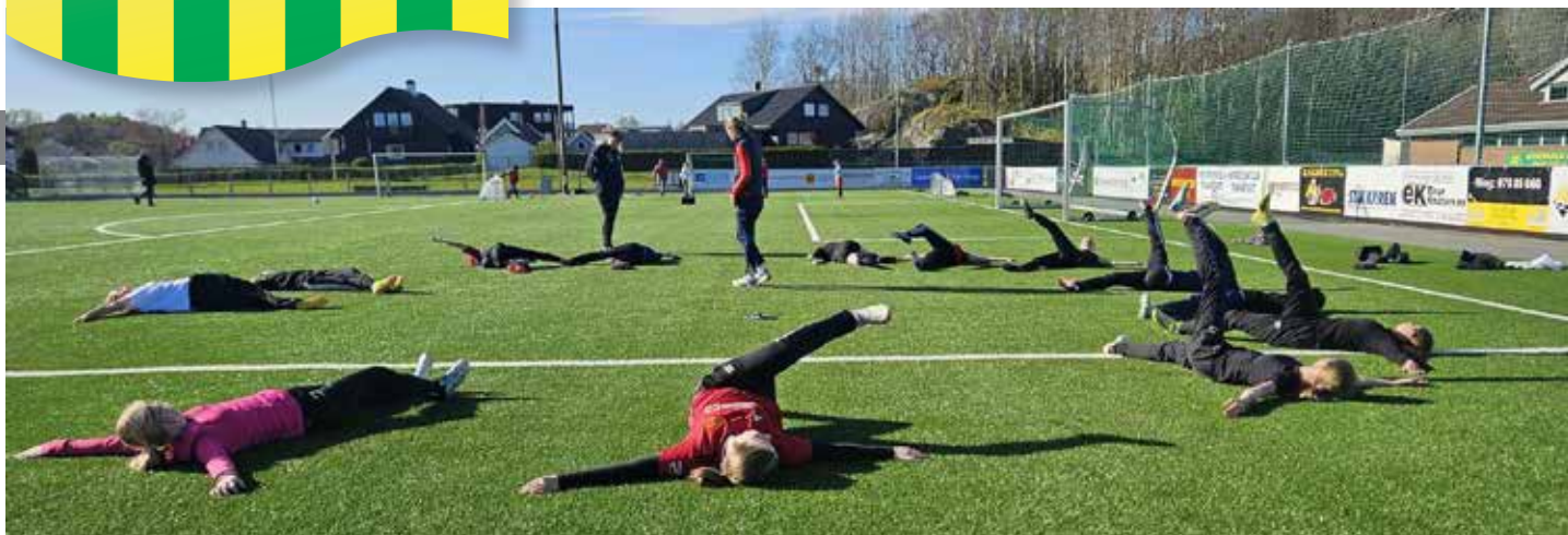
Skadeforebyggende trening med besøk fra kretsen.