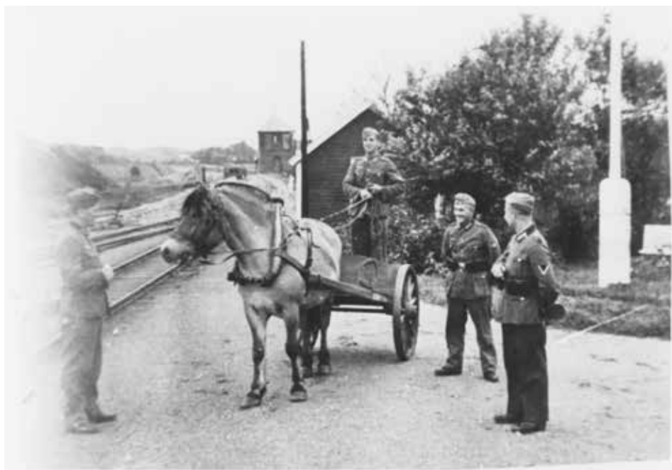
Fra heftet «Krigsminne frå Ogna, Brusand og Øvra Bygdå» av Otto Laurits Fuglestad.

Han vinka til far og ropte: "Hurra for Fedrelandet!" Då skjøna far at det var alvor.