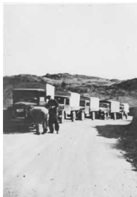
Tyske lastebiler på Ogna/Varden.

«Jeg hadde vært på Kverme og lekt med noen barn der, og så gikk jeg jernbanelinjen sørover på vei hjem. Jeg så folk som feiret og kjørte rundt med lastebiler; hoiet og ropte og var glade. Folk samlet seg på stasjonen og