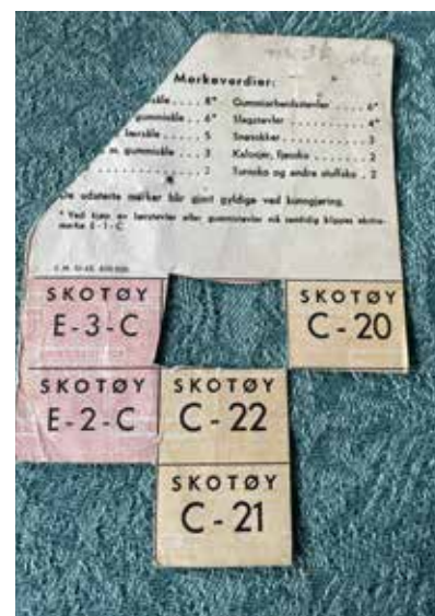
Malena Yrke har tatt vare på rasjoneringskort («klippekort») fra 2. Verdenskrig.

tekstil, sko osv. Folk ble veldig smarte i gjenbruk av garn og stoff for å lage klær forteller hun, man kunne rekke opp strikkede klær og brukte garnet om igjen. Man sydde om å laget fine, godt brukende plagg.